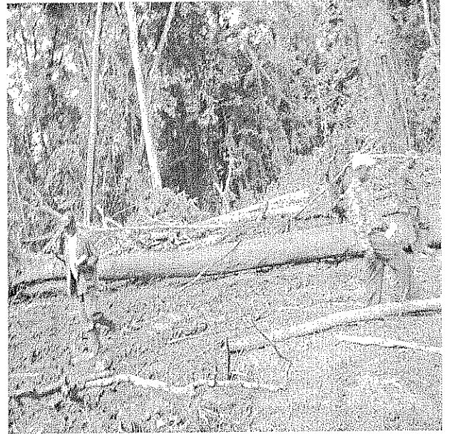
Fig 2 : Bois abattu par la société SG SOC et disséminé en forêt